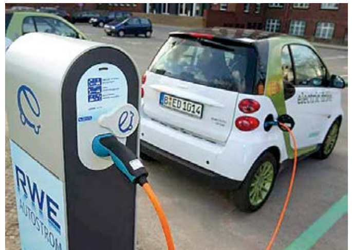
Ponto de recarga de carros elétricos, comum nas ruas de Paris

Além disso, os híbridos são bem menos poluentes e os elétricos não produzem CO 2 algum.