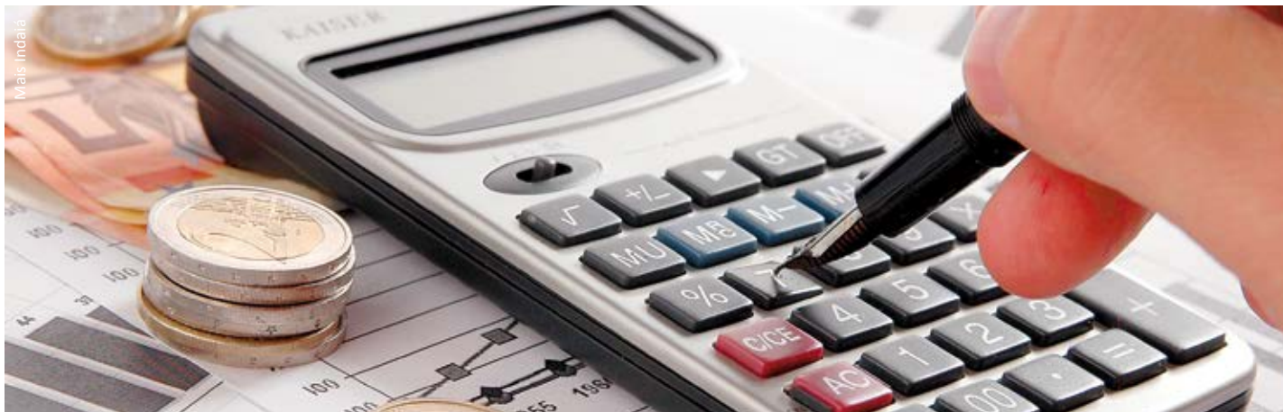
Educação financeira é fundamental para o cidadão tomar decisões conscientes

Um estudo feito pela Serasa Experian mostrou que 36,6% dos consumidores que estavam inadimplentes regularizaram suas pendências no final de 2012, mas voltaram a contrair dívidas em 2013.