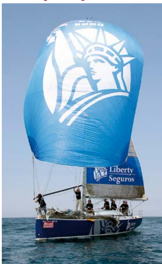
Seguro de Embarcações Particulares de Recreio – Liberty Mar – um dos muitos produtos da grande empresa.

Apenas 21% das seguradoras oferecem aplicativos