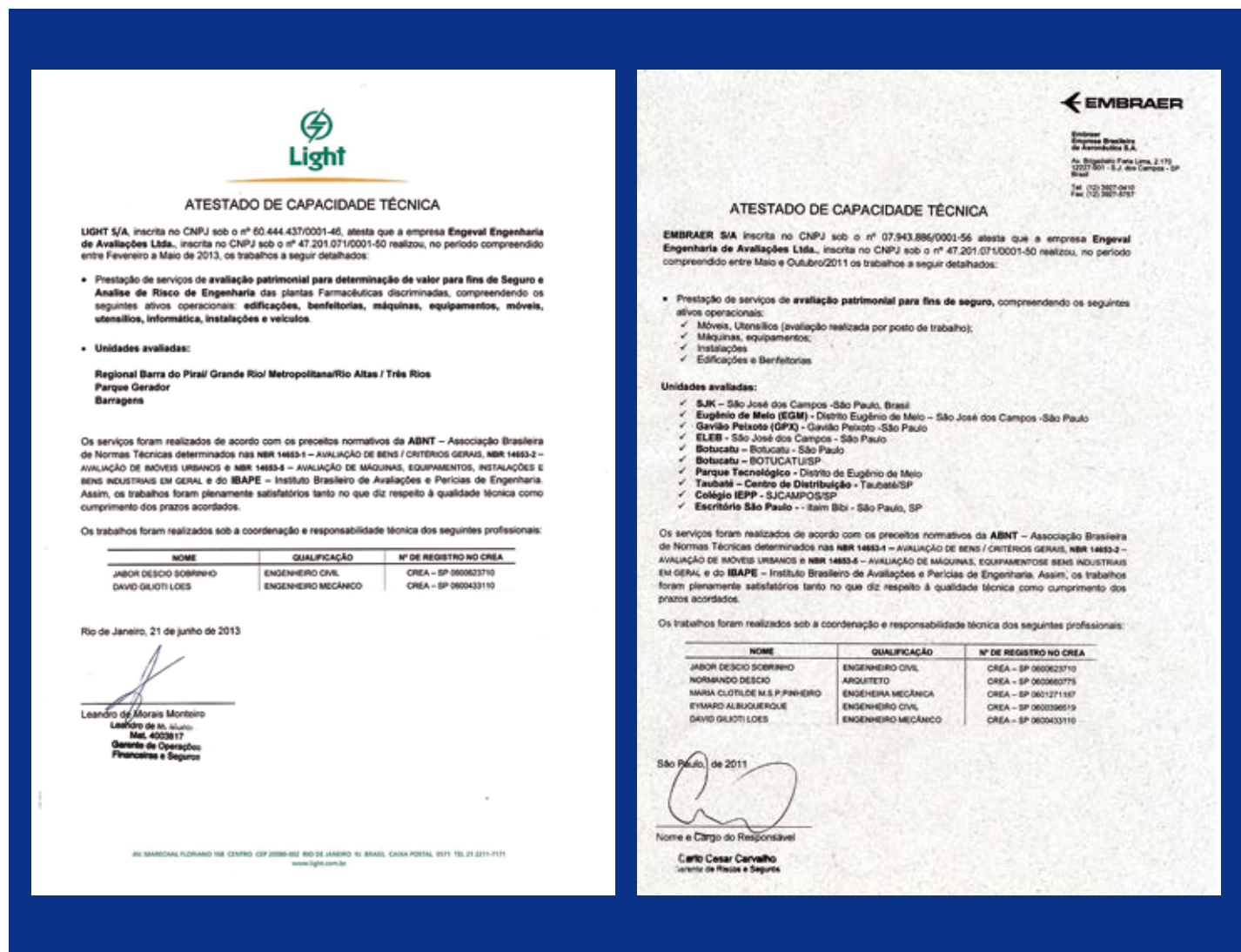
Embraer e Light: empresas conferiram atestado de capacidade técnica à Engeval, segundo preceitos da ABNT e Ibape

A Engeval é uma empresa firmemente consolidada no Brasil e em nível internacional por meio da ArcaLaudis. Nossa visão é que devemos manter constantes os investimentos em tecnologia e aperfeiçoamento profissional, além do continuado esforço comercial para mantermos e expandirmos a posição que conquistamos. Porém é forçoso reconhecer que também dependemos em grande parte da conjuntura econômica brasileira e mundial que podem afetar diretamente os nossos mercados de atuação.