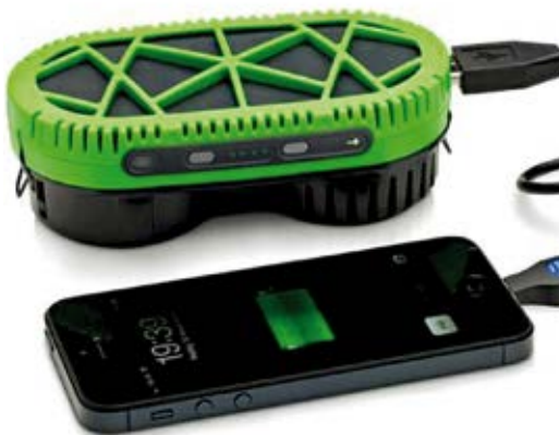
Powertrekk, carregador portátil à base de água

O valor é de aproximadamente 650 reais (199 euros).