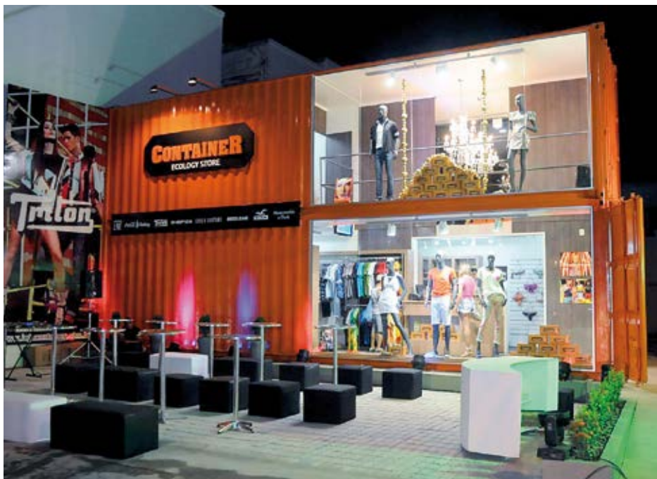
Loja da Triton é exemplo de construção em contêiner

Os contêineres podem ser comprados de importadoras, por exemplo.