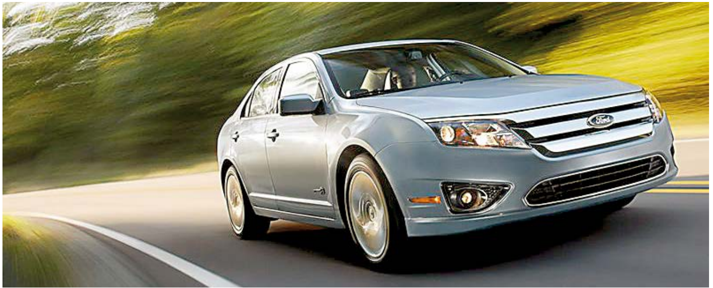
Ford Fusion Hybrid é atestado pelo Inmetro como o carro mais econômico do país, capaz de fazer 16,8 km/l em São Paulo, por meio de um motor elétrico atuando em conjunto com um de combustão

Hybridos e elétricos por um ar mais puro