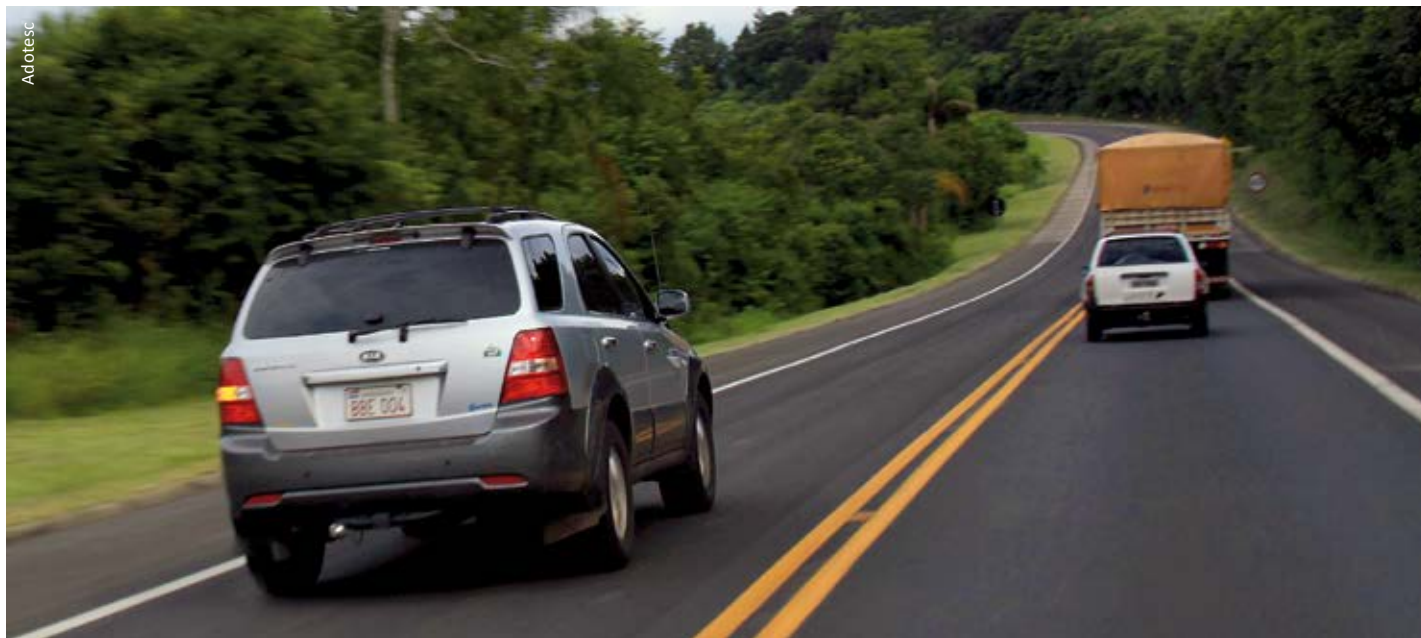
Uma ultrapassem segura evita as colisões frontais: imprudência é o sinal mais evidente

Pouco se fala em direção defensiva, que poderia evitar muitos acidentes graves