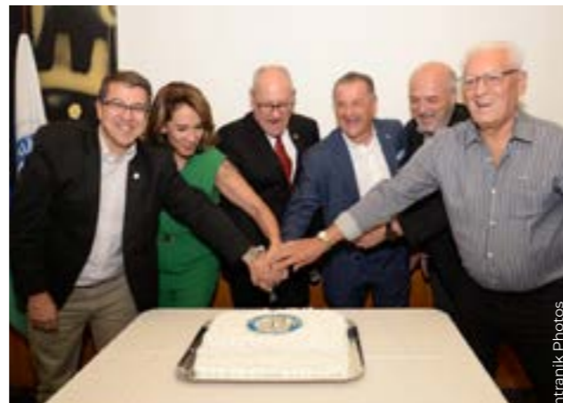
Diretoria reunida para o momento sublime: o corte do bolo de aniversário