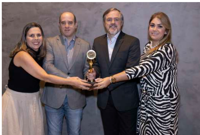
Executivos da Ituran durante o Troféu Gaivota de Ouro

A empresa segue investindo em novas soluções para tornar o seguro automotivo mais seguro, eficiente e acessível, consolidando sua posição como referência em inovação e monitoramento de veículos no Brasil.