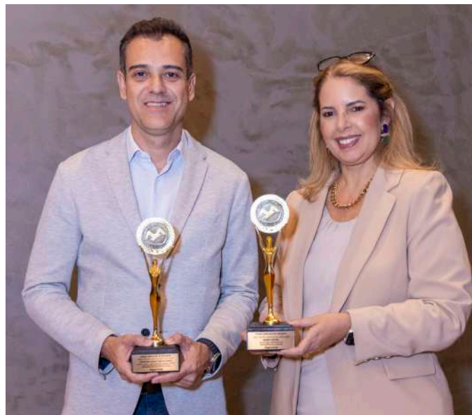
Executivos da MAWDY no Troféu Gaivota de Ouro 2024

A MAWDY segue firme em seu compromisso de oferecer serviços de excelência,