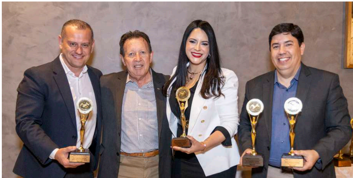
Bradesco Seguros recebe homenagens durante o Troféu Gaivota de Ouro 2024

O Grupo Bradesco Seguros foi um dos grandes destaques do 24º Troféu Gaivota de Ouro, promovido pela Revista Seguro Total, evento que reconhece as empresas mais influentes do setor segurador nos últimos 12 meses. A companhia recebeu quatro premiações, consolidando sua posição de liderança no segmento de Vida e Previdência.