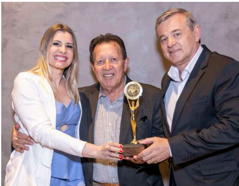
Grupo Fetra recebe homenagem durante o Troféu Gaivota de Ouro 2024