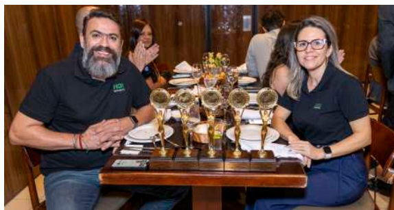
Executivos da HDI no Troféu Gaivota de Ouro 2024

A premiação no Troféu Gaivota de Ouro 2024 consolida a HDI como uma das seguradoras de maior impacto no mercado, reafirmando sua liderança e compromisso com a excelência em seguros no Brasil.